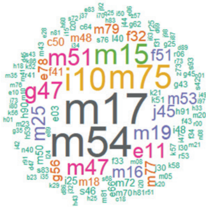
Kuvio 3. Työuraeläkettä hakeneiden sairaustausta sanapilvellä kuvattuna. Kaikki lääkärinlausuntoihin liittyvät diagnoosit.